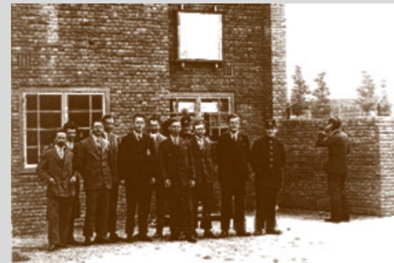
Tijdens de Olympische Spelen van 1928

Bij de restauratie is geprobeerd zoveel mogelijk de oorspronkelijke detaillering te reconstrueren. CASA heeft hiervoor o.a. een uitgebreid kleurhistorisch onderzoek gedaan. Break Out Events huurt het gebouwtje nu als ontmoetingsruimte.