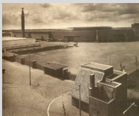
Het Olympisch Stadioncomplex