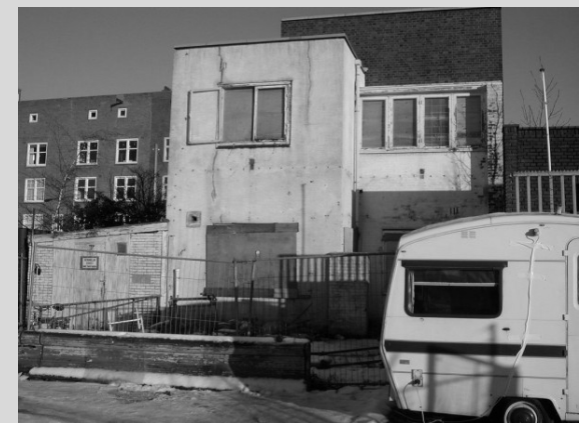
Vlak voor de start van de restauratie