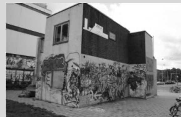
Na de verplaatsing, voor de restauratie